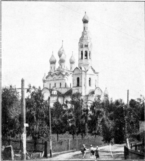
TERIJOEN VENÄLÄINEN KIRKKO.

Venäläistä aikakautta edustaa vielä sängen näkyvästi heidän hohtoisen valkoinen kirkkonsa. Se on kekkeelle paikalle rakennettu, se loistaa joka paikkaan, se hallitsee koko ympäristöä.